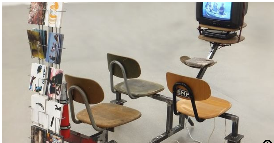
Das Künstlerkollektiv BMP gewann mit seiner Installation „Das Reisemobil – universelle Mobilität“ den Kunstpreis Worpswede 2017.