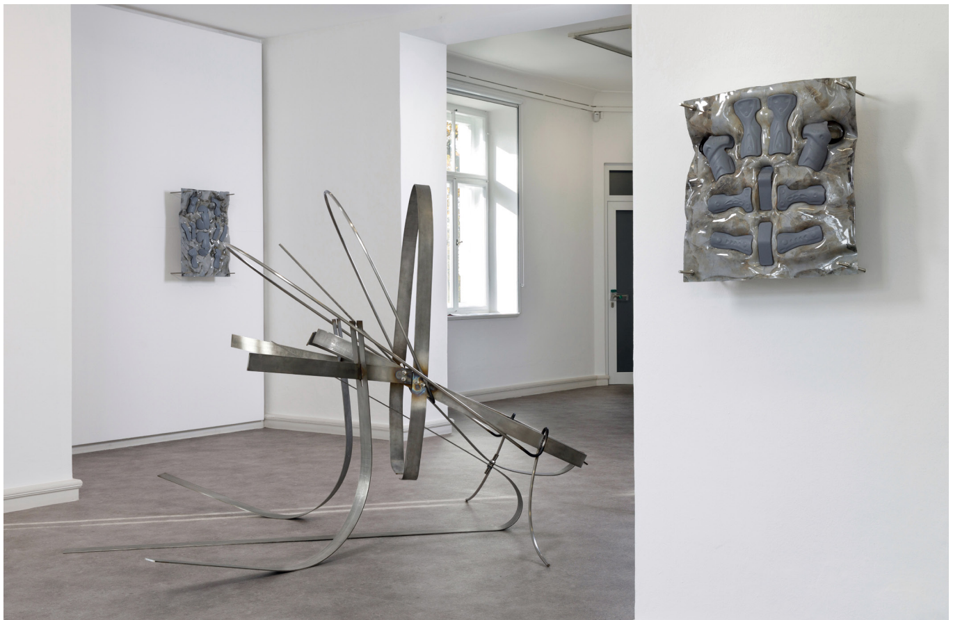
Abbildung: © Anna Lena Keller, Ausstellungsansicht „Peeling“ Kebbelvilla Schwandorf, „Limitation game 1“, „soft crust“, 2023

Artists Program, Kalifornien (USA 2023); Stipendium „Junge Kunst und neue Wege“, Freistaat Bayern (2022); Stipendium des Cusanuswerk e.V., Bonn (2022); Erasmus Stipendium (Italien 2019); Bayerischer Staatspreis (2013). Ihre Arbeiten waren u.a. zu sehen bei: Produzentengalerie Hamburg (2022); Deutsches Museum München (2021); Galerie der Stadt Schwaz (AT 2021).