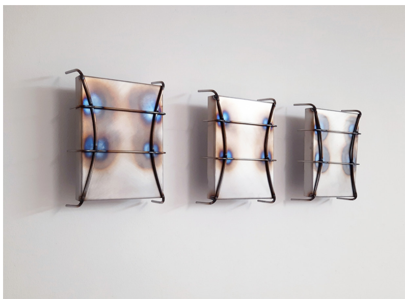
Abbildung: © Anna Lena Keller, „bugs“, 2023