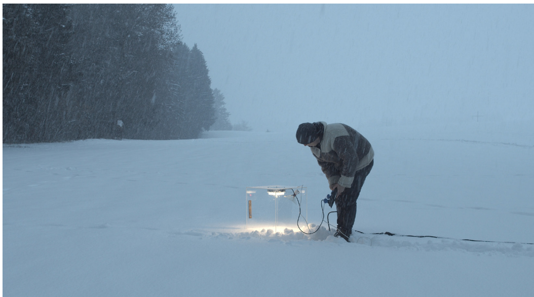
GROWTH CUBE, Videostill, 2021